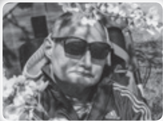
外は気持ちいいね