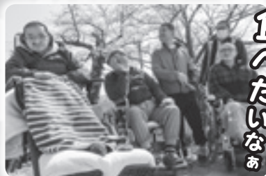
だんごを食べたいなあ