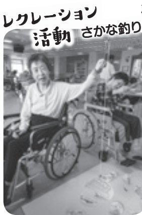
レクリエーション 活動 さかな釣り