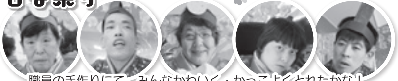
職員の手作りにて、みんなかわいく・かっこよくとれたかな!