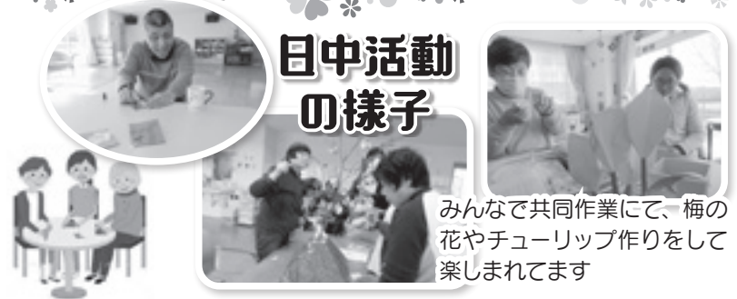
みんなで共同作業にて、梅の 花やチューリップ作りをして 楽しまれています