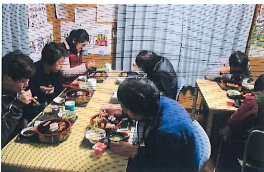
みなさん黙々と食べています

どうして、こどもの日は休みなのに ひなまつりは休みじゃないの？ チコちゃんも知らなそうなので 考えるのはやめてアートな作品を 作りました。いかが？ でも、お祭りは食べるのが1番ね。