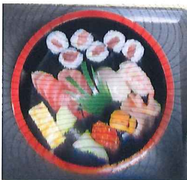
かぶき鯔さんの上寿司