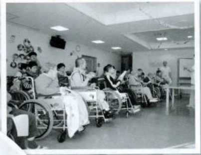
さあ、歌いましょう 合唱団による発表