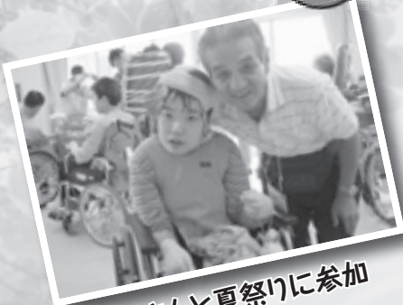
お父さんと夏祭りに参加