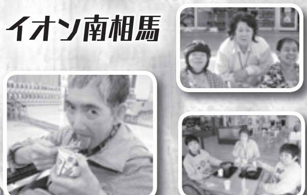
アイスや食事とりました。