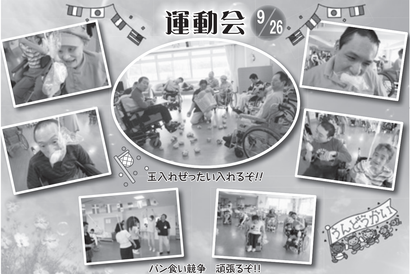
玉入れぜったい入れるぞ!!