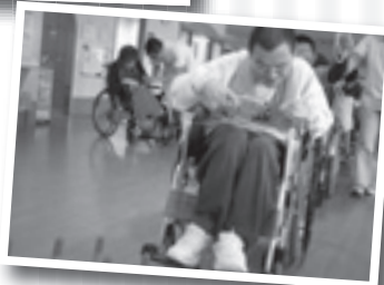
願い事叶いますように☆