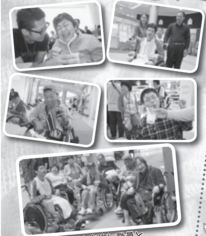
たのしく家族と職員と 買い物しました。