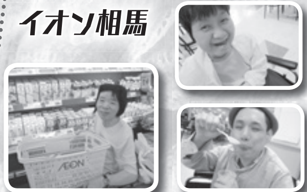
買い物してきたよ!!