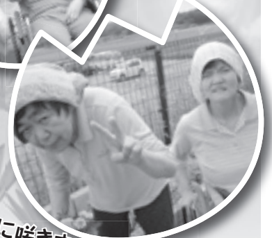
きれいに咲きますように♡