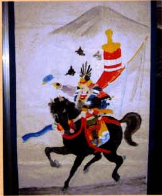
5周年記念賞 「いざ出陣!!」 高木 純也様