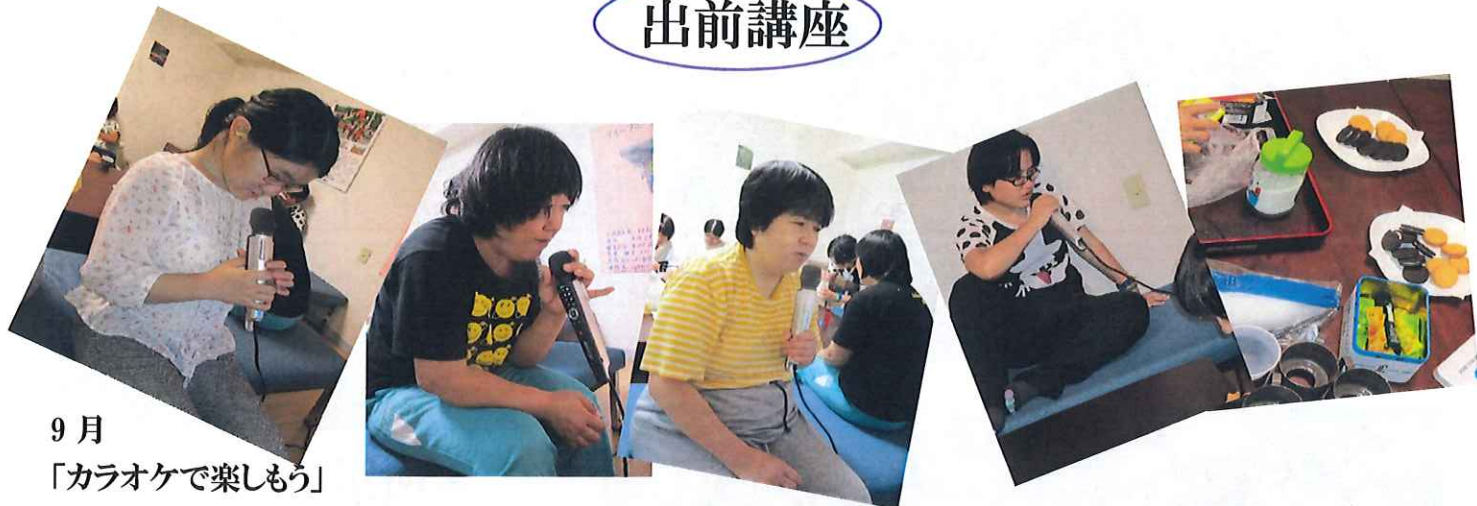
9月 「カラオケで楽しもう」