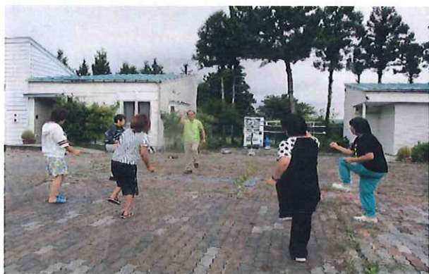
9月「手軽ストレッチ」