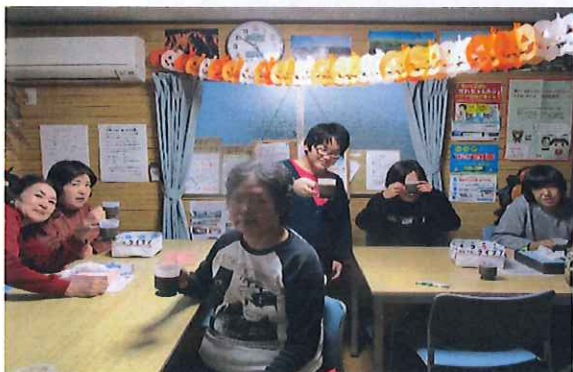
10月 「ハロウィン 飾り付け」