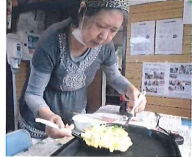
うまく返せるかな？