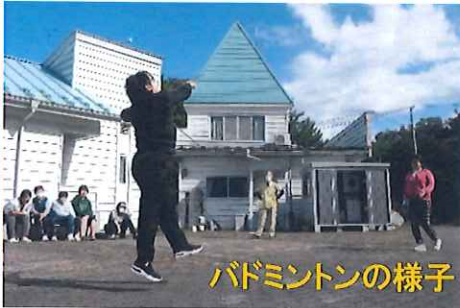
バドミントンの様子

7月に発足した利用者様の自治会「あじさいの会」主催のイベントを初めて行いました！企画から調理まで自分たちで考え、大成功でした☆ボール遊び・バドミントン・納涼会で好評だった吹き矢は皆さん腕を上げ大盛り上がりでしたよ(^)/昼食は、食べたかったお好み焼き・広島焼き・焼きそば！調理班・片付け班、それぞれお疲れさまでした。